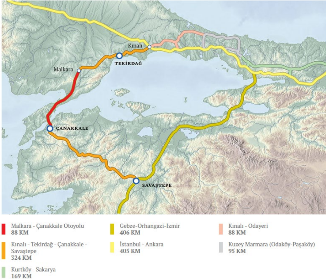
Şekil 1. Kınalı - Balıkesir Otoyol Projesi

Proje, ulusal kalkınma amaçlı projelerinden biri olan 324 km uzunluğundaki daha geniş Kınalı - Tekirdağ - Çanakkale - Savaştepe Otoyolu'nun ( Şekil 1 ) bir parçasıdır.