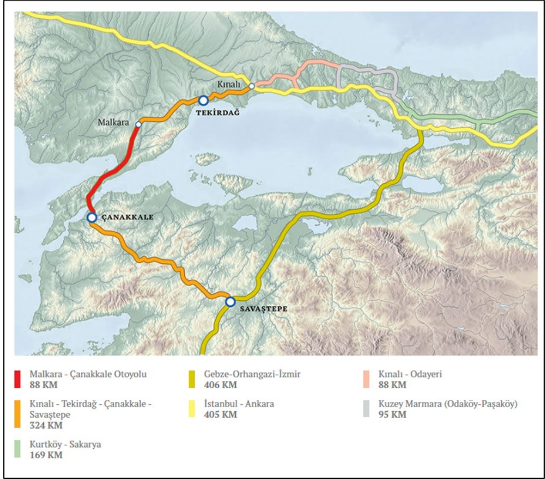
Şekil 1 Kinalı-Tekirdağ-Çanakkale-Savaştepe Otoyol Projesi

2019'da hazırlanan ilk versiyonundan itibaren Paydaş Katılım Planı (PKP), Proje web sitesi aracılığıyla kamuoyu ile paylaşılmış, bu sayede PKP ve Proje hakkında toplumun yorum ve görüşlerinin alınmasına olanak tanınmıştır. PKP bu yorumlar ve projede katedilen aşamalar doğrultusunda düzenli aralıklarla güncellenmekte olan bir belgedir.