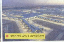
İstanbul Yeni Havalimanı