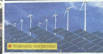
Yenilenebilir enerjide rekor