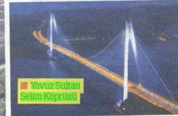
Yavuz Sultan Selim Köprüsü