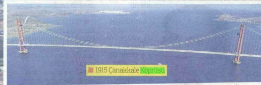
1915 Çanakkale Köprüsü